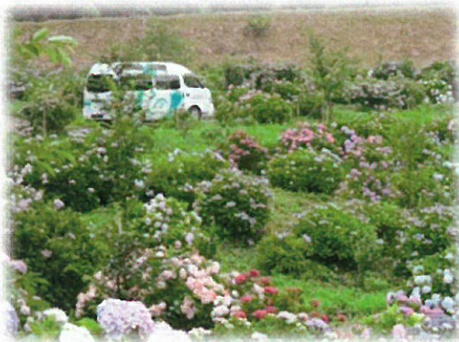
車窓より（西植田町の勝名寺）

今後も、皆様楽しんで頂ける活動を提供していきたいと思っておりますので、どうぞよろしくお願致します。