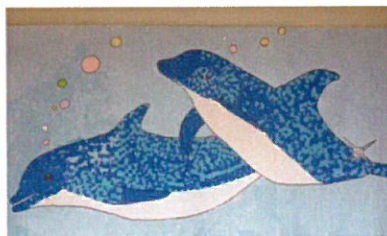
6月共同制作 イルカのちぎり絵