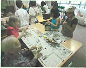
子供達との交流会

舜虹苑認知症対応型デイサービスは、利用者様とご家族様をサポートするとともに、デイサービスをj利用することで生活に楽しみを持ち、自宅での生活を継続するお手伝いができればと平成三十年四月より日曜日の営業とサービス提供時間を九時三十分〜十七時（一時間半延長）としました。日曜日に利用して頂くことで、利用者様は生活パターンが作りやすくなり、年末年始以外営業することで、緊急時には利用頂きやすくなり安心して在宅生活をサポートすることができまs。また時間を延長することで、利用者様へより充実したレクリエーションを行えるようになりました。これからも利用者様をはじめ、ご家族様にも喜ばれ、頼られるデイサービスを目指して、様々なサービス提供に努めてまいりたいと思います。