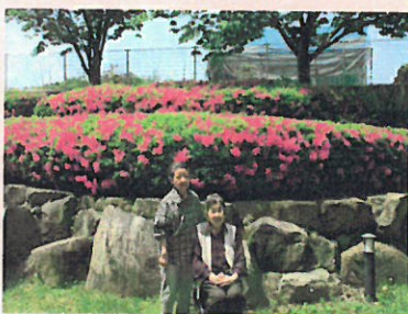
庭の手入れも手伝って下さいます。

5月に入り、ケアハウスの庭のつつじが満開です。ケアハウス竜雲では20名の方が生活されておりますが、みなさん毎月の行事を大変楽しみにされており、今度は何を食べに行こうか、何作るんな、どこに連れて行ってくれるんな。」とお声があります。今年度も利用者様が「良かったで」と言っjて頂ける行事を計画していきます。