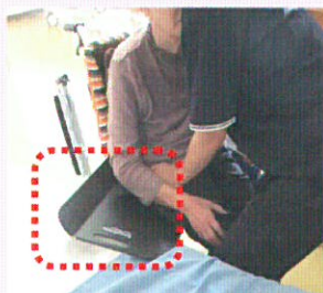
②イージーグライド