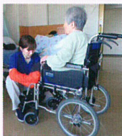
①ポジショニンググローブ（腰に常備）