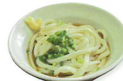
ぶっかけうどん 170円