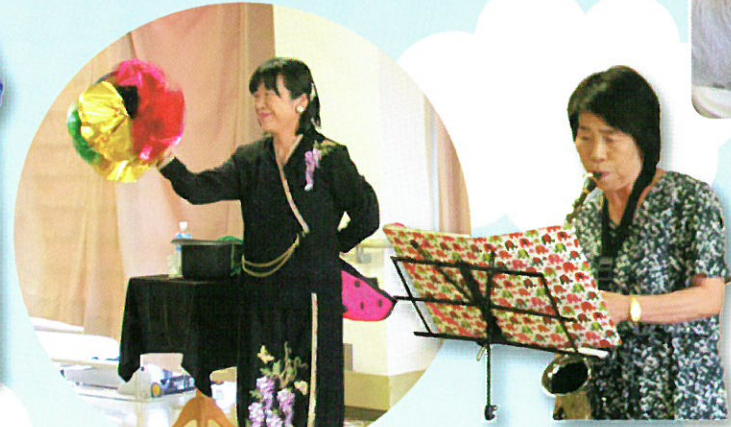
ボラえもんの皆さん