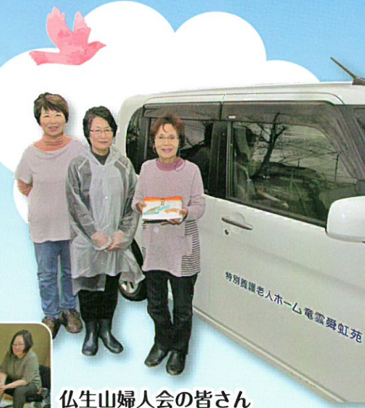
仏生山婦人会の皆さん