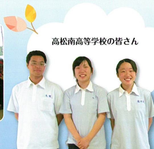
高松南高等学校の皆さん