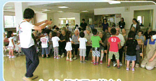
カナン保育園の皆さん