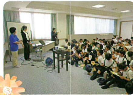
仏生山小学校の皆さん