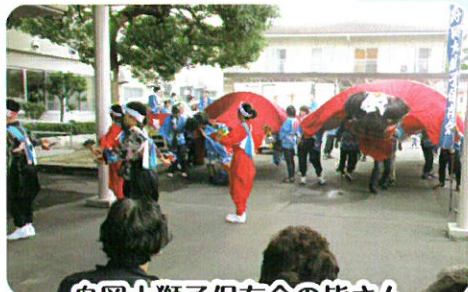
舟岡大獅子保存会の皆さん