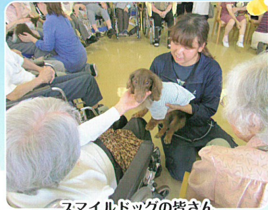
スマイルドッグの皆さん