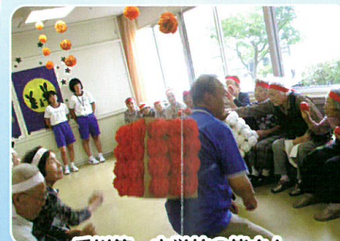
香川第一中学校の皆さん