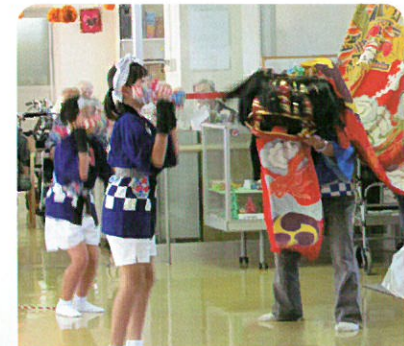
上神宮寺神社獅子保存会の皆さん