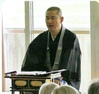
浄土宗南海教区の皆さん