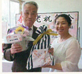
苑長から、「お祝いおめでとうございます」とお花のプレゼントです。